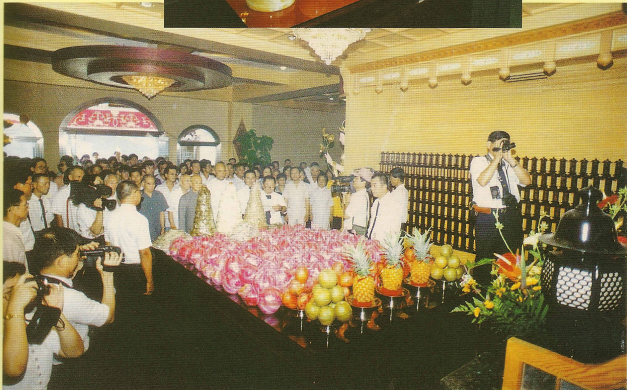
△一樓大殿備有豐盛之供品以表至誠。