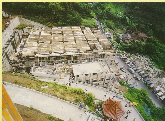
△基礎先天總壇—忠恕道院，工程已興建至五樓。