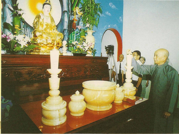
▷張老前人主持南海古佛安座典禮。