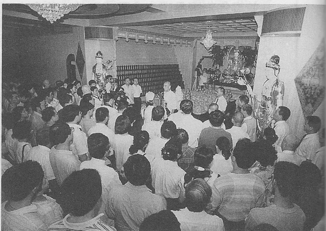
△入塔先賢之遺屬代表參加統一祭拜。