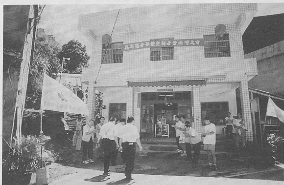
△位於三峽鎮有木站的慈樞中堂。

下午有多人蒙受道的感召而求道，並有八位道親清口當愿。推行素食文化，乃是時代所趨，願素食的普及，更能帶給人類身心健康的生活環境。