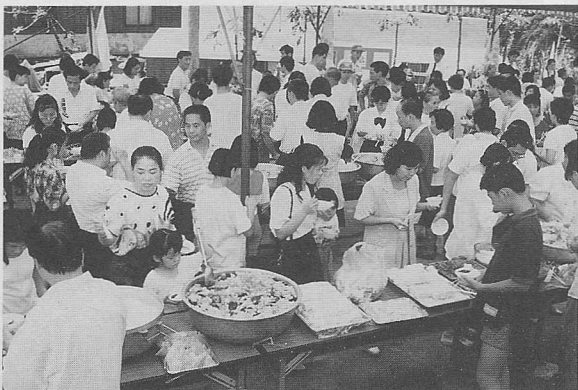
△素齋品嚐大會現場一景。