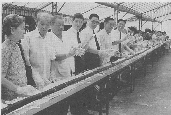
△點傳師、道親們通力合作一百人長壽司。