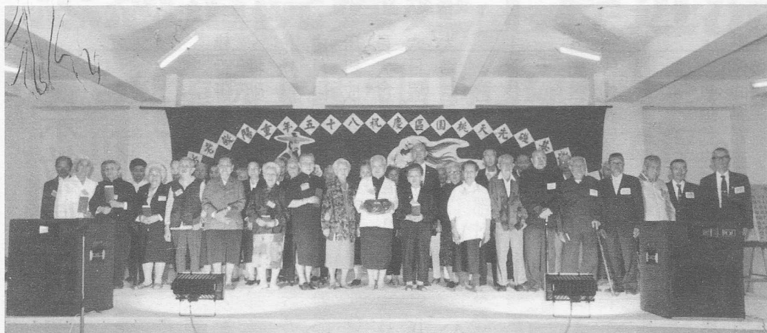
△簡前人致贈七十歲以上老菩薩禮物。