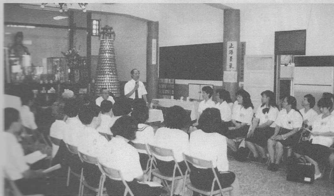
△高潮迭起的「唇槍舌戰」。

，有各顯口才的腦力激盪，有屏除雜念喚醒本性的心靈迴響。法會的課程完全是由學員們參與策劃，在班長、輔導學長的協助下完成，主要是讓學員們能多方面學習，各展所長，但願學員能更加精進，個個皆成爲稱責的辦事員。整個法會課程也在白點傳師結班賜導中，劃下完美的句點。