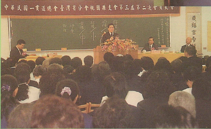
△林金生點傳師主講：修道辦道應有的時代使命。